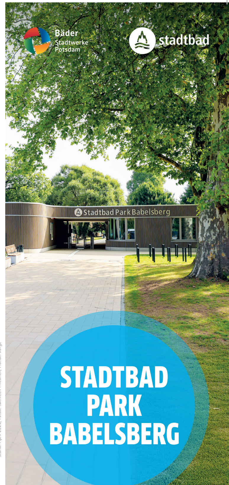
Stand: April 2026; Fotos: Kathleen Friedrich, Florian Sorge

blp-potsdam.de blp-shop.de baeder_potsdam baederpotsdam